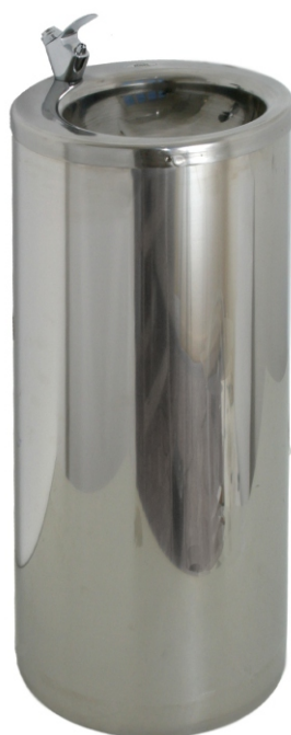
Fontaine publique 1700 colonne en acier inoxydable