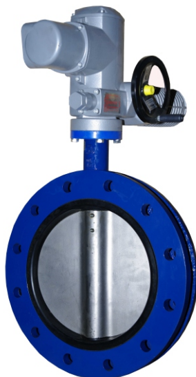
Vanne papillon centré motorisée DN400