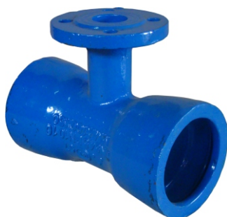
Té à deux emboîtements et sortie bride MMA 9205