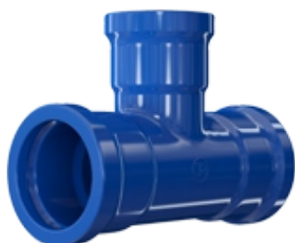
Té à 3 emboîtements MMB 9206